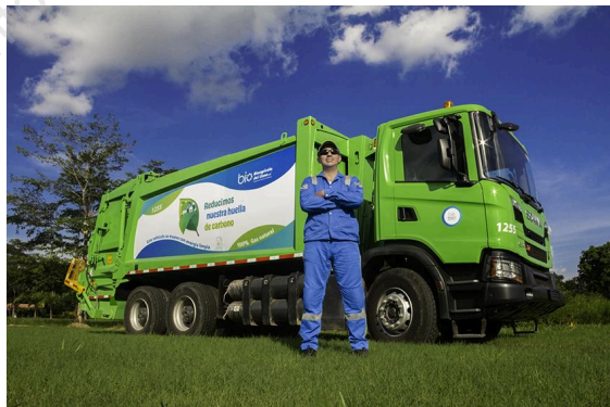
Ilustración 1. Vehículo recolector de residuos ordinarios.

Bioagricola del Llano cuenta con una flota de 27 vehículos recolectores tipo compactador de entre 17 y 28 Yd 3 , los cuales son utilizados para la recolección de residuos ordinarios. Para la recolección de los grandes generadores, se hace uso de contenedores de 3 y 5 yardas cúbicas, para lo cual, el 20% de los vehículos cuenta con el sistema de recolección de contenedores de 3 yardas, también para la recolección de contenedores de 5 yardas cúbicas se tiene un vehículo tipo Ampliroll. Adicionalmente, 16 de nuestros vehículos cuentan con sistema de izaje Lifter para contenedores plásticos de hasta 1100 Litros.