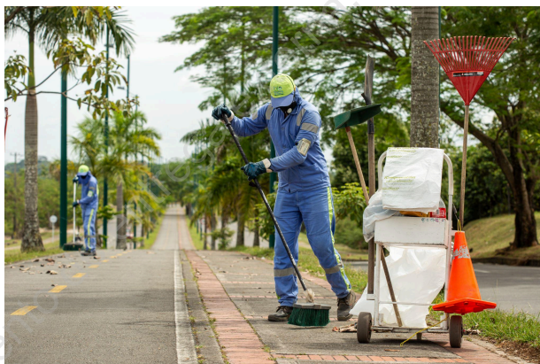
Ilustración 2. Actividad de Barrido y Limpieza

Es importante indicar que para la prestación del servicio de Barrido y limpieza en la ciudad de Villavicencio, no aplica los respectivos acuerdos de barrido y limpieza con la Administración Municipal.